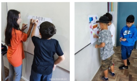
Imagem 1 e 2 : Confeção de cartazes com recortes de logos encontrados.

A partir do segundo mês de ações, foi estudado o que são logomarcas e sua importância na sociedade. Durante as aulas, os alunos assistiram vídeos explicativos, realizaram atividades de identificação de logos, fizeram pesquisa e confeccionaram cartazes, bem como exploraram alguns jogos relacionados ao tema.