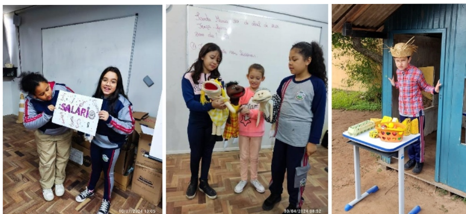
Imagem 7 e 8: Registros das apresentações de teatro