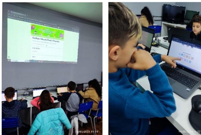
Imagem 9 e 10: Alunos realizando uma avaliação digital