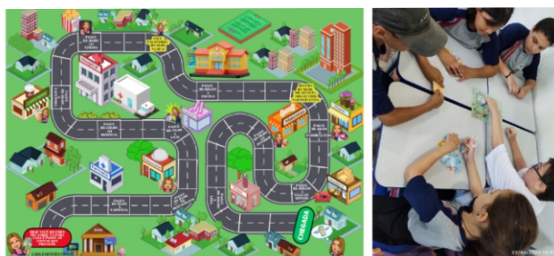
Imagem 3 e 4: Imagem do jogo da trilha e alunos a explorando

Além de colocar o aluno no centro do processo de aprendizado, a ludicidade perpassa praticamente todas as atividades do projeto. Como forma de tornar as aulas mais atrativas, também são propostos jogos, muitos criados e produzidos pela própria professora. Um jogo confeccionado digitalmente pela professora foi do tipo trilha, conforme ilustrado nas imagens abaixo.