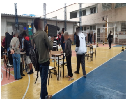
Imagem 2 – Alunos experimentando os jogos confeccionados

Proporcionamos a expressão de manifestações artísticas e culturais através da dança e teatro; motivamos a criação e doação de brinquedos reciclados para a Educação Infantil; promovemos o uso de diferentes linguagens, permitindo que os alunos expressassem idéias, sentimentos e informações através das danças, teatro, esporte e jogos. O evento foi divulgado no site de comunicação da Prefeitura Municipal de Juiz de