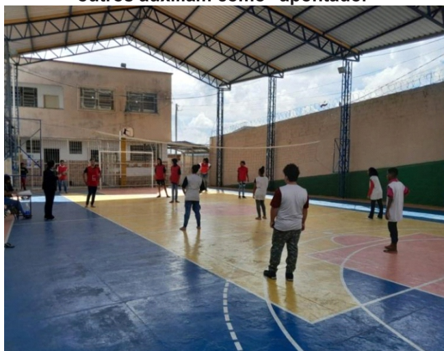
Imagem 7 – Esporte, alunos jogam e outros auxiliam como "apontador"