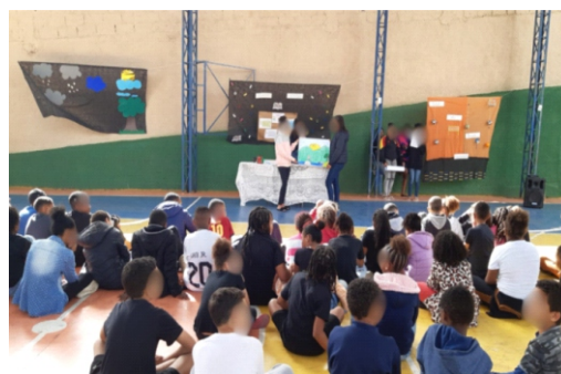
Imagem 3 – Apresentação do jornalzinho