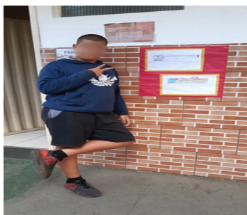
Imagem 4 – Aluno expressando seus sentimentos em forma de cartaz

Após a conclusão, incentivamos a expressão de aprendizados através de textos ou desenho sobre "O que aprendi?", exibidos nos murais da escola. Em geral os alunos demonstraram atitudes positivas com relação à inclusão e, grande parte deles solicitaram que tivessem outros eventos similares. Os professores e a escola reafirmaram a crença no potencial transformador de práticas pedagógicas inclusivas.