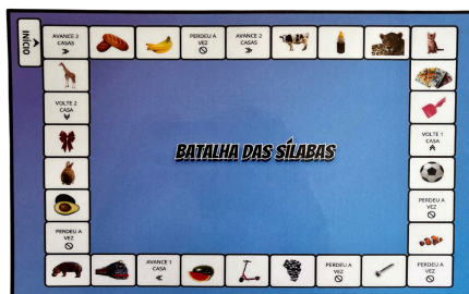
Imagem 4. Tabuleiro do jogo “Batalha das sílabas”