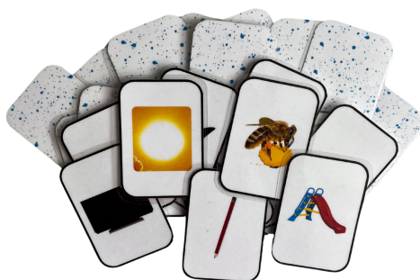
Imagem 3. Cartas do jogo “Batalha das sílabas”