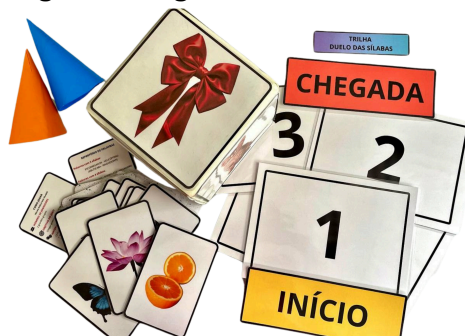
Imagem 5. Jogo “Duelo das sílabas”