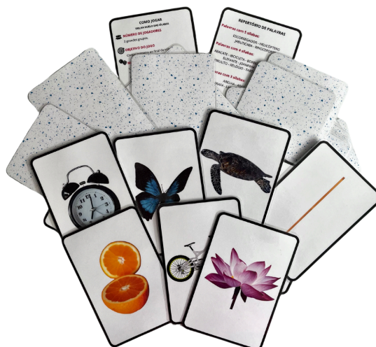
Imagem 7. Cartas do jogo “Duelo das Sílabas”