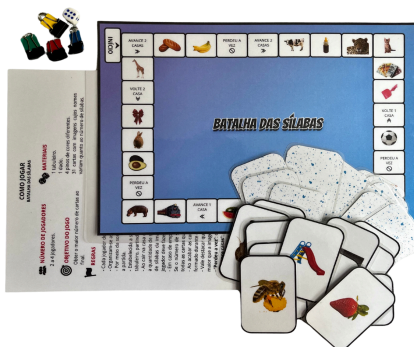
Imagem 2. Jogo “Batalha das sílabas”