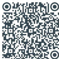
Imagem 1. QR Code para acesso aos jogos didáticos de alfabetização